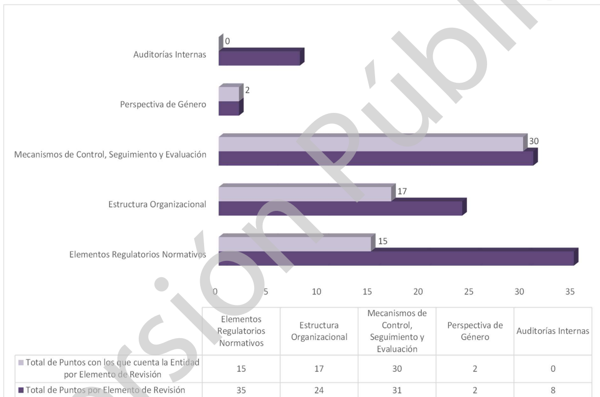
Gráfica 1 Cumplimiento de los Mecanismos de Control Interno Ejercicio 2020